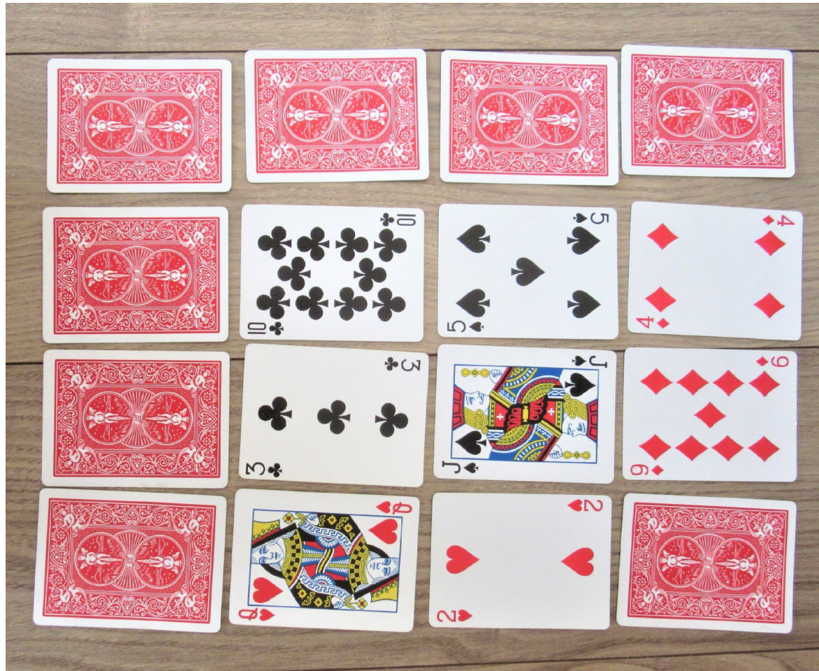
X 8枚のミニアチュアカード