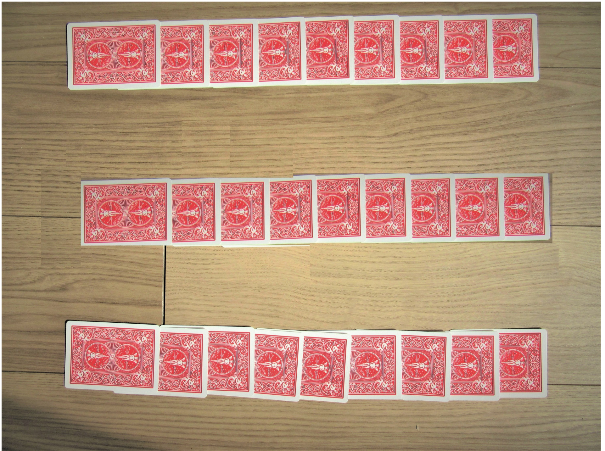
G. 27枚裏向き・・・4枚必要