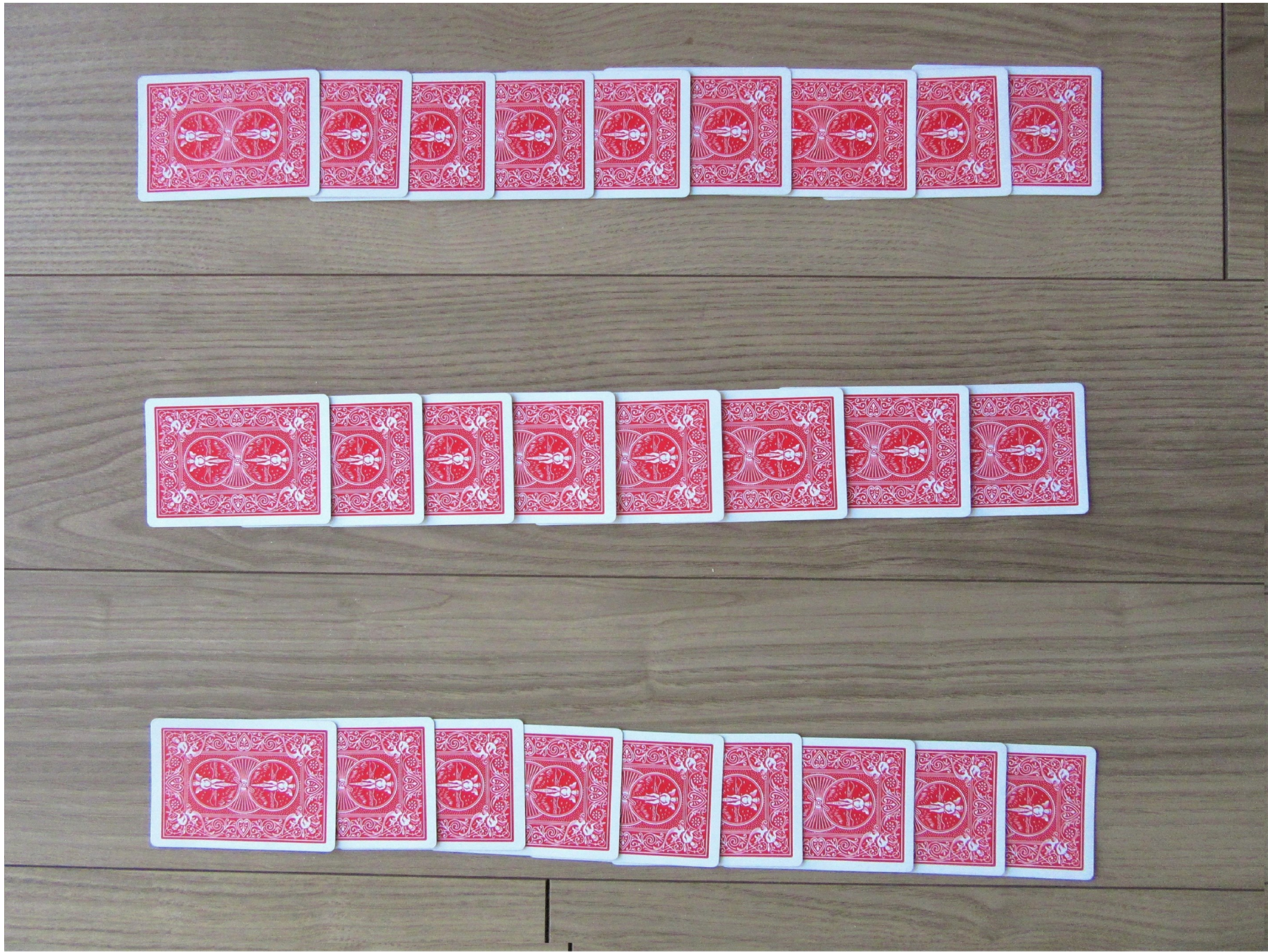
1. 26枚裏向き . . . . . 4枚必要