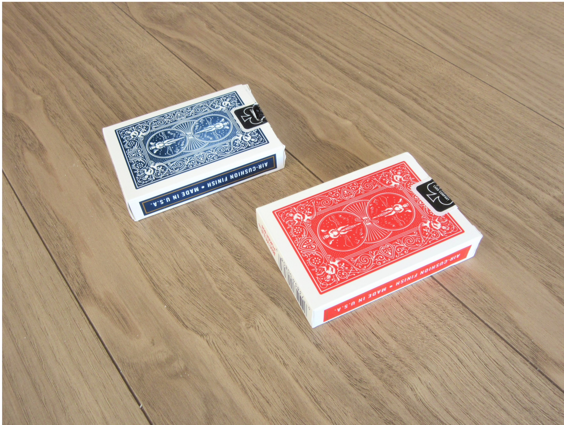
B. 赤青カードケース